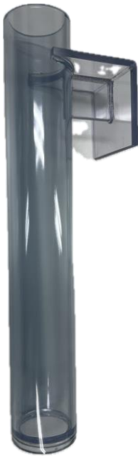
ペンチューブホルダー