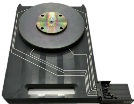
半導体ウェーハ用めっき治具