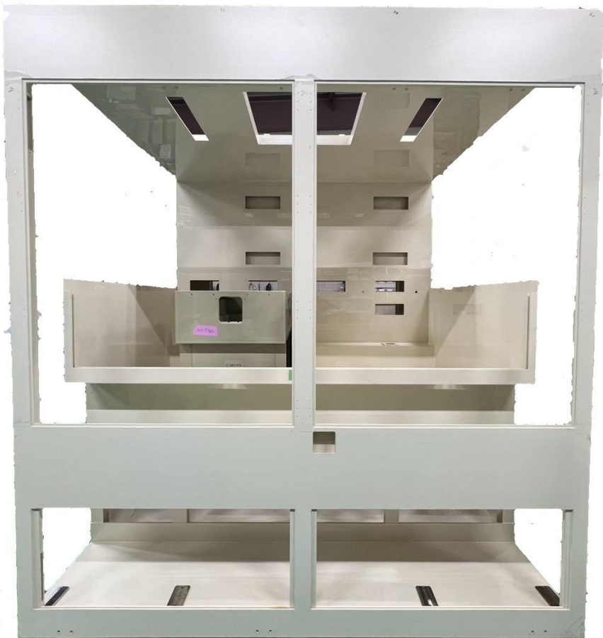
SUSフレーム塩ビ巻き